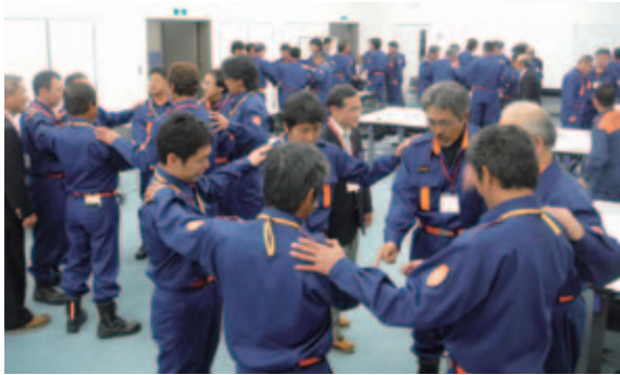
S-KYT研修の様子②（タッチ&コール）