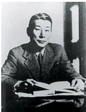
▲杉原千畝領事代理