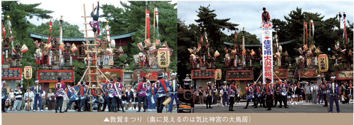
▲敦賀まつり（奥に見えるのは気比神宮の大鳥居）

つり」(9月2日～4日)に参加し、隊員達はまつりを彩どる山車(やま)の前で見事な演技を披露し、県内外から集まった多くの観客から大きな喝采を浴びました。