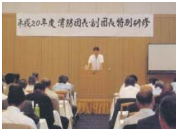
講演している日本赤十字社指導員

16日に中国地方を襲った台風13号による局所的な集中豪雨では活動中の消防団員が河川に転落し、悲しくも殉職する事故が発生しました。また、消防基金の資料等によれば、毎年全国で10名の尊い生命が失われているそうです。