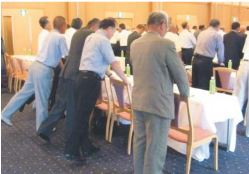
腰痛予防、肩こり解消のためのトレーニング