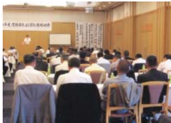
熱心に耳を傾けている受講者

当協会を構成する消防団では、数件の公務災害が毎年発生しております。特に平成18年9月