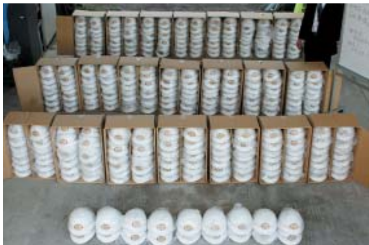
安全装備品（ヘルメット）

今後とも消防団員の安全装備品の充実を図るとともに、研修事業を含めた公務災害防止事業を計画的に行い、消防団員の公務災害防止に努めたいと思います。