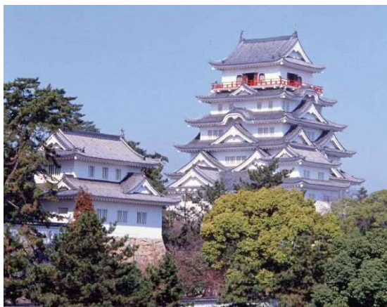
新幹線ホームから間近に見える福山城

市内には、古くから潮待ちの港として栄えた「鞆の浦」や、鎌倉時代に明王院の門前町として栄えた、芦田川中洲の「草戸千軒町遺跡」などを擁し、