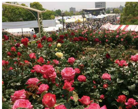
バラの花が咲き誇る緑町公園（福山ばら祭）

団本部には団長1人、副団長8人、団本部訓練指導員8人、女性消防団員30人が所属しています。各分団は8つの方面隊に分かれており、副団長が各