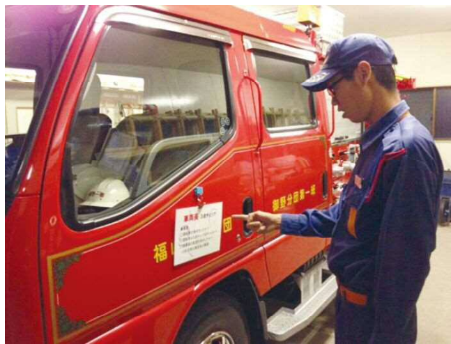
車両事故撲滅に向けた対策（車両長の確認事項）

今後も、定期的に入団する新入団員への教育と、ベテラン団員の慣れからくる気の緩みを防ぐためにも、継続実施していく中で、負傷・車両事故ゼロの消防団活動に努めていきます。