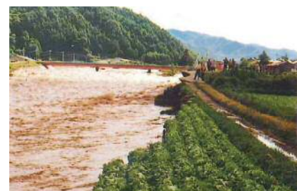
当時の川上村の原・埴下地区の様子