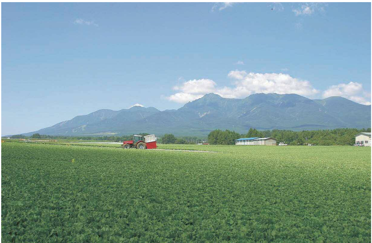
川上村のレタス畑

（編注）次ページ以降に「ダニエル・カールの教えて！村長さん～長野県川上村訪問編～」を掲載しています。