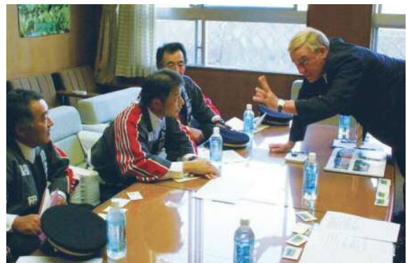
白熱する取材の風景

ダニエル それは、良かったです。今年だけの大雪であったことを望みたいですね。もし雪対策などが必要でしたら、御相談ください。山形には、詳しい友達がたくさんいるので、御紹介しますよ（笑）。