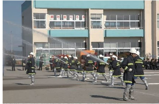
防火衣を着用して放水

いですが、日頃から消防団幹部や事務局が団員の健康状態を把握する必要性を認識し、災害現場や訓練に臨むことで公務災害を未然に防ぐこととなります。