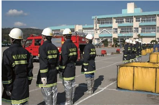
防火衣を着用しての訓練